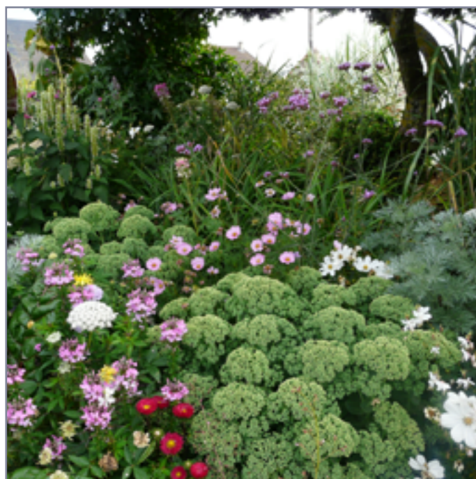
Plate-bande arbustive en mixed-border, Boussac-Bourg (23)

Ce travail, qui peut sembler complexe au premier abord, peut se faire accompagné de professionnels, tout en gardant la maîtrise dans le choix des végétaux.