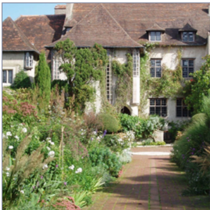
Bois des Moutiers, Varengueville-sur-Mer (76)

Exemple de composition simple en mixed-border, avec quatre essences végétales.