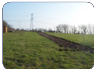
Préparation du sol : retourner une bande de la largeur de haie voulue

Carpinus betulus - Charme commun - BETULACEAE Acer campestre - Erable champêtre - ACERACEAE Corylus avellana - Noisetier commun - BETULACEAE Crataegus monogyna - Aubépine - ROSACEAE Rosa canina - Eglantier commun - ROSACEAE