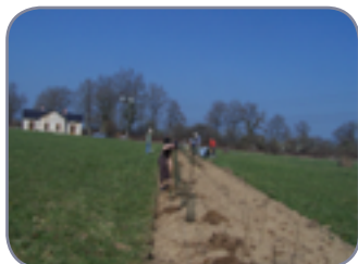
Protection des jeunes arbres par un filet, contre les rongeurs et grands herbivores