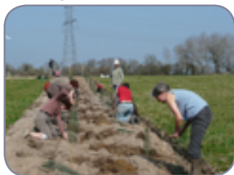
Suivant la saison, arroser abondamment. Possibilité de pailler.

La haie champêtre ou bocagère est une association végétale de plusieurs espèces végétales, de tailles différentes, bien adaptées au sol et au climat.