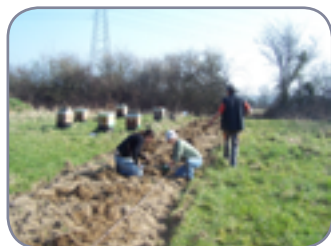
Une fois les fosses de plantations creusées, plantation des baliveaux (jeunes plants)